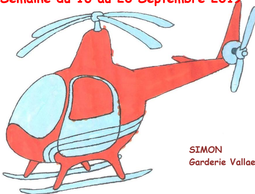
SIMON Garderie Vallaeys