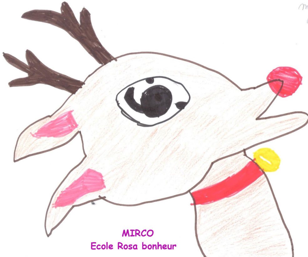
MIRCO Ecole Rosa bonheur