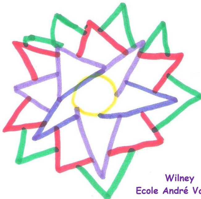
Wilney Ecole André Vallaëys